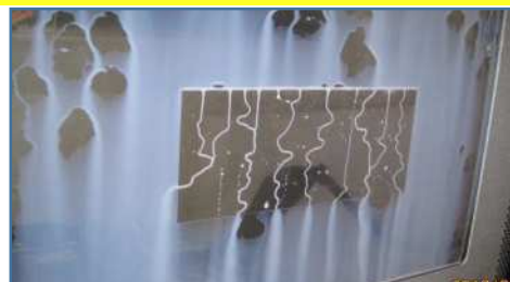
※イメージ写真となります。 加工液を止めて1秒後の状態です。